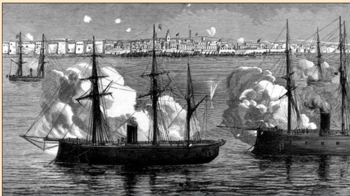
l'escadre française tire sur les remparts de Sfax.

J'ai passé aujourd'hui toute la journée dans les ruines encore fumantes et brûlantes de Sfax.